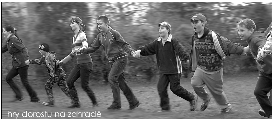
hry dorostu na zahradě

Pro děti funguje ve sboru vyučování biblických hodin, setkávání dorostu a mládeže, nedělní škola a další aktivity, kde je nejen možno smysluplně trávit volný čas, ale také se něco užitečného přiučit. A je to také příležitost jak být spolu, jak navazovat přátelství a učit se vzájemnému porozumění a toleranci.