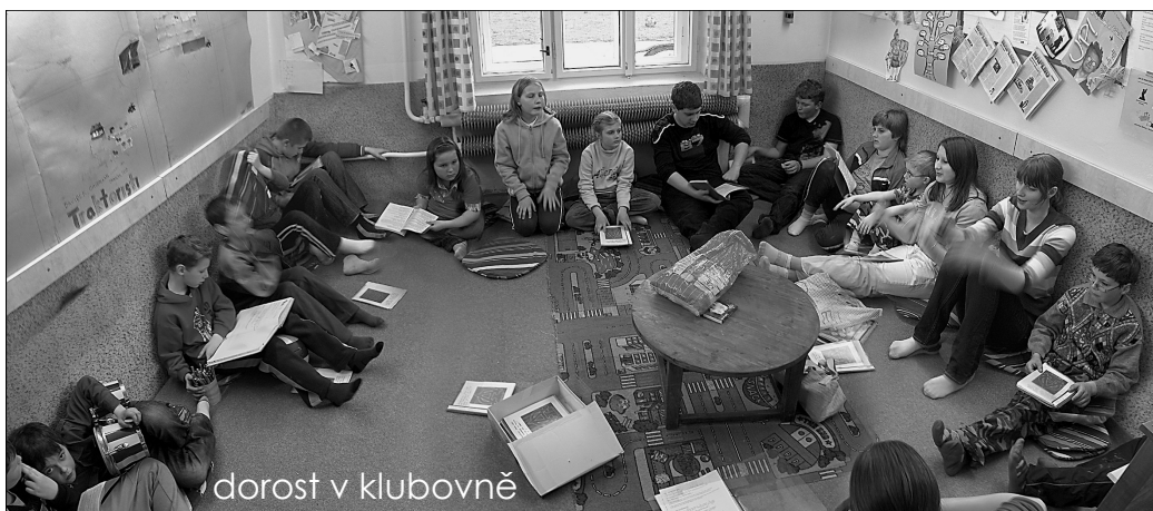
dorost v klubovně